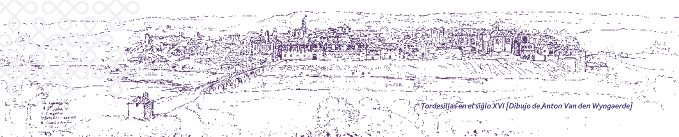
Tordesillas en el siglo XVI [Dibujo de Anton Van den Wyngaerde]

Una publicación de la Oficina Municipal de Turismo de Tordesillas